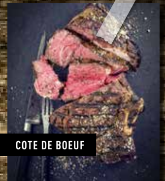
COTE DE BOEUF