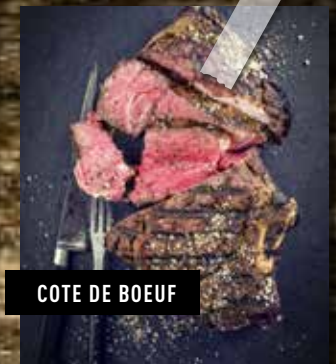
COTE DE BOEUF